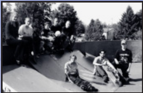
Quelques passionnés du skate park