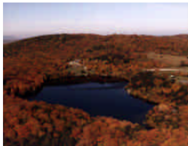
Secteur de Lac Gale