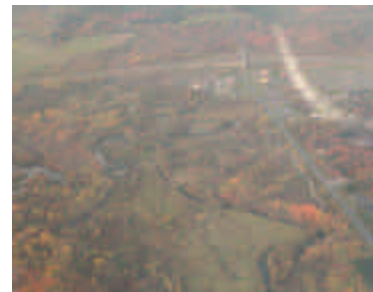
Secteur de la rivière Yamaska