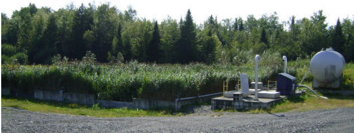
Un des 2 lits de roseaux de la station de la ville de Bromont. Photo : Wai Loi Wong, Ville de Bromont, 2010.

Les boues passent par un dégrilleur (qui retient les objets solides indésirables pour le traitement) et tombent après dans le bassin de rétention. A l'aide d'une pompe, les boues sont envoyées sur les lits de phragmites.