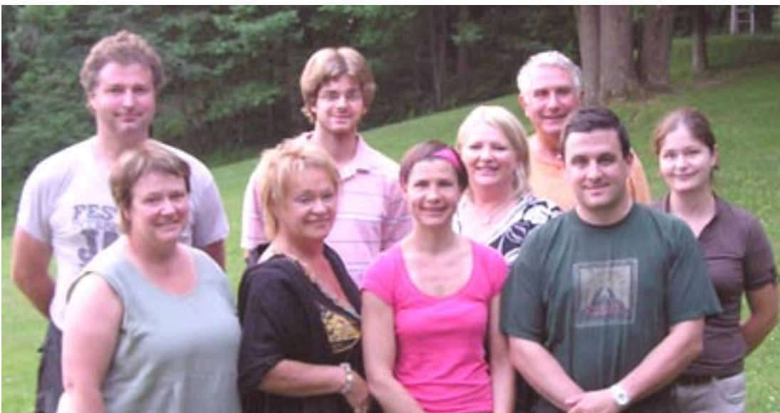
LES MEMBRES DU COMITÉ D'ADMINISTRATION

Vous êtes intéressé à donner du temps pour aider l'ACBVLB ? Vous n'avez pas besoin d'être un spécialiste. Vous êtes invité à communiquer avec nous.