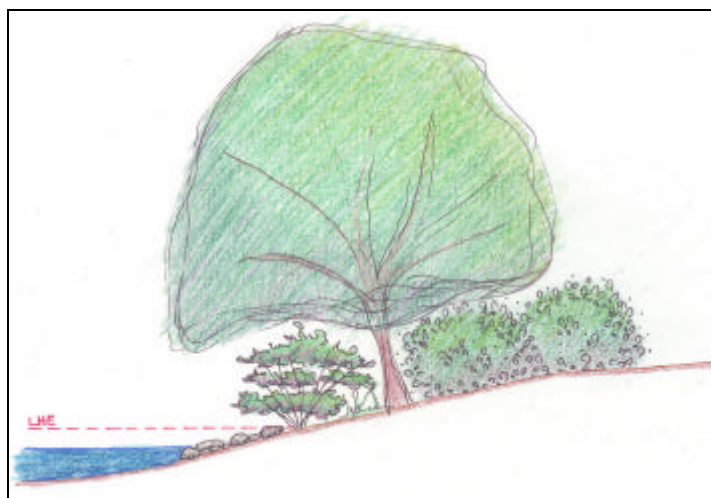
Croquis : Sabine Vanderlinden, Ville de Bromont, septembre 2010

S'il n'y pas de plantes aquatiques, à l'endroit où les plantes terrestres s'arrêtent en direction du plan d'eau :